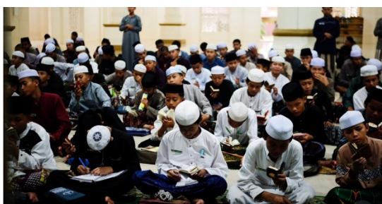
Gambar 5. Suasana membaca Al-Qur`an Berjamaah

Ditambah lagi kegiatan di luar kelas dimana para santri diwajibkan sholat berjamaah dan membaca Al-Qur`an bersama, ini adalah bentuk dari ide yang menginginkan terbentuknya para santri yang beriman dan bertaqwa kepada Allah SWT. Kepedulian Pondok Modern pada bakat-bakat para santrinya, maka disediakan kegiatan ekstrakurikuler pada bidang olahraga dan seni. Ekstrakurikuler olahraga cukup banyak pilihannya. Bukannya hanya disediakan fasilitas olahraganya, namun juga diberikan bimbingan langsung oleh para santri senior dan guru. Ini membuktikan kepedulian Pondok Modern kepada kesehatan jasmani para santrinya. Ini membuktikan apa yang menjadi ide dari Pondok Modern yang ini menjadikan para santrinya berbadan sehat.