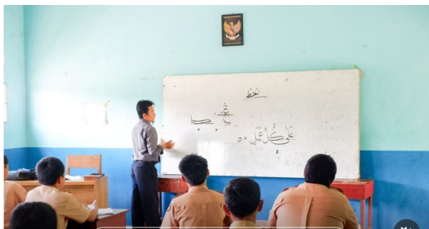
Gambar 3. Suasana Pembelajaran Di Dalam Kelas (Intrakurikuler)

Kegiatan di dalam kelas (intrakurikuler) adalah kegiatan belajar mengajar secara klasikal. Kegiatan pembelajaran di Pondok Modern Darul Hijrah dan Pondok Modern An-Najah Putra dilaksanakan dari hari senin sampai hari sabtu, dari pukul 07.30 sampai dengan pukul 13.30. kecuali hari jumat yaitu sampai pukul 11.00. Kedua Pondok Modern ini juga memiliki jumlah jam pelajaran yang sama yang diadakan dari hari senin sampai sabtu yaitu sebanyak 8 jam pelajaran. Setiap jam pelajaran memiliki durasi waktu selama 40 menit, kecuali hari jumat yang hanya 35 menit setiap jam pelajarannya. Waktu istirahat pembelajaran ada dua kali dalam sehari, yaitu setelah selesai jam pelajaran ketiga dan keenam yaitu selama 25 menit, kecuali hari jumat yang hanya ada satu kali waktu istirahat yaitu setelah jam pelajaran ketiga.