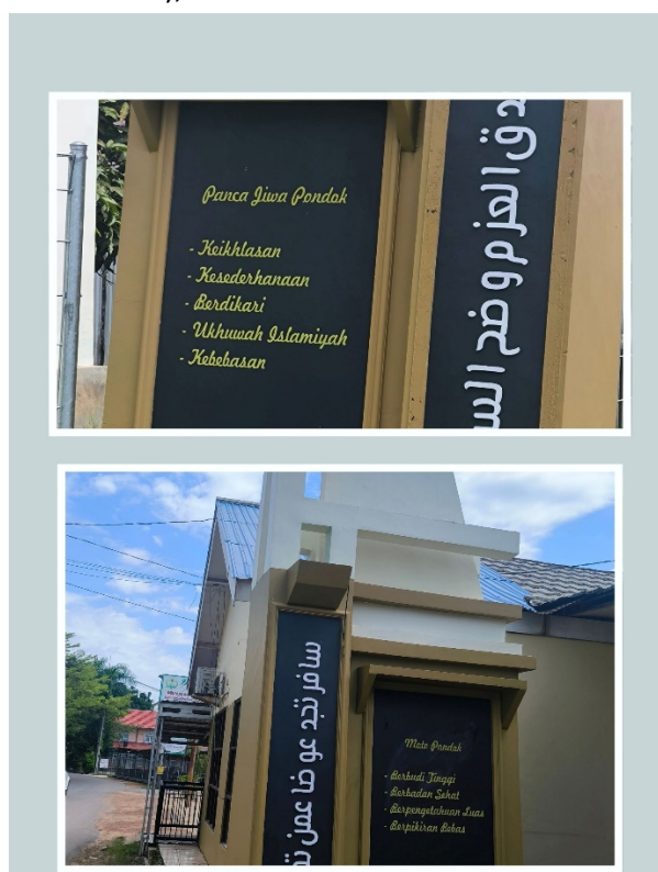
Gambar. 1 Panca Jiwa dan Motto Pondok Tertera di Gerbang Masuk Pondok

Kurikulum TMI adalah kurikulum yang mengadaptasi dari kurikulum KMI yang diterapkan di Pondok Modern Darussalam Gontor. Kurikulum ini memiliki Moto dan Panca Jiwa Pondok. Maka tidak terkecuali Pondok Modern Darul Hijrah Martapura dan Pondok Modern An-Najah Putra Tambang Ulang yang menerapkan Kurikulum TMI. Sebagai pondok alumni Gontor tentu keduanya memiliki isi dari motto dan panca jiwa pondok yang sama. Motto Pondok Modern terdiri dari berbudi tinggi, berbadan sehat, berpengetahuan luas, berpikiran bebas. Sedangkan panca jiwa Pondok Modern terdiri dari Keikhlasan, kesederhanaan, berdikari, ukhuwah Islamiyah (persaudaraan sesama umat Islam), dan Kebebasan. 21