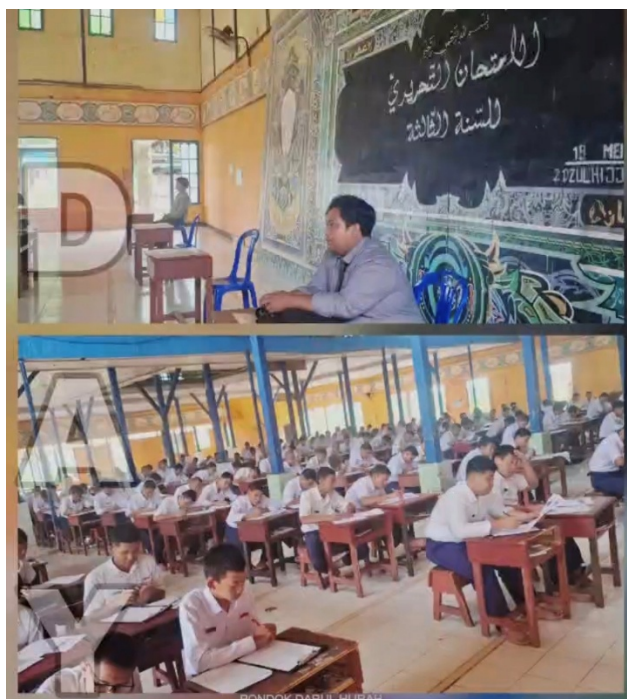
Gambar 6. Suasana Ujian Tertulis Pondok Modern

Aspek penilaian ketuntasan pembelajaran santri yang terdiri dari beberapa aspek ini menandakan bahwa Pondok Modern tidak hanya menilai dari segi pengetahuan saja. Menurut Saifudin Sabda, bahwa sebaiknya penilaian hasil belajar tidak hanya menilai dari aspek pengetahuan saja, akan tetap aspek lain seperti keterampilan dan sikap peserta didik juga mendapat perhatian dari para pendidik untuk di evaluasi. 59 Maka dua aspek pertama yang ada pada sistem penilaian hasil belajar di kedua Pondok Modern ini, yaitu aspek kehadiran dan aspek kedisiplinan merupakan bentuk penilaian pondok terhadap sikap para santri selama beraktivitas di dalam lingkungan pondok.