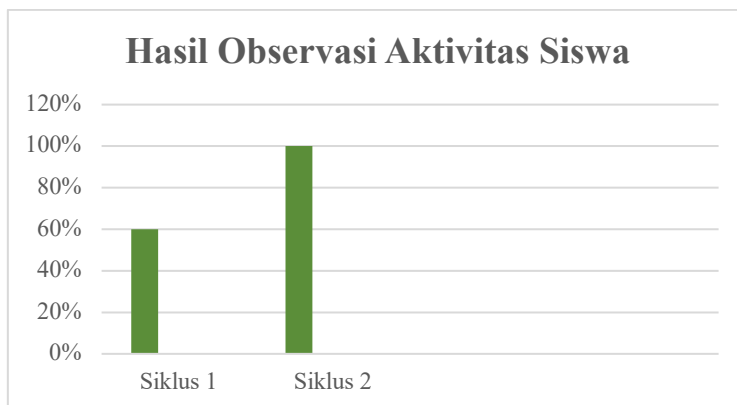
Gambar 4. Perbandingan Aktivitas Siswa Siklus I dan Siklus II

Hasil belajar siswa juga menunjukkan adanya sebuah peningkatan. Pada Siklus I, rata-rata nilai kelas masih berada pada angka 74 dengan ketuntasan klasikal sebesar 60%, sehingga masih belum mencapai indikator keberhasilan yang telah ditentukan sekolah. Setelah dilakukan perbaikan pembelajaran pada Siklus II, terjadi peningkatan yang signifikan pada hasil belajar siswa. Rata-rata nilai kelas naik menjadi 90, dan seluruh siswa berhasil mencapai KKM dengan tingkat ketuntasan klasikal sebesar 100%.