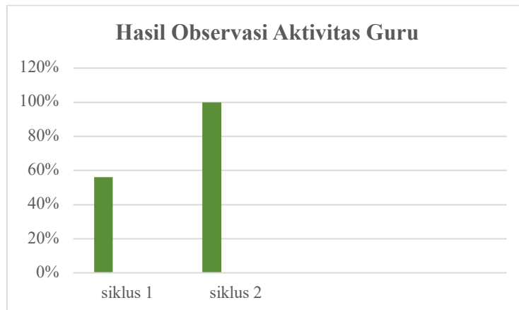
Gambar 3. Perbandingan Aktivitas Guru Siklus I dan Siklus II

besar kepada siswa untuk terlibat secara aktif. Selain itu, penggunaan waktu menjadi lebih efisien sehingga seluruh rangkaian pembelajaran dapat berlangsung dengan baik. Berdasarkan hasil observasi, aktivitas guru pada Siklus II mencapai 100%, yang menandakan bahwa seluruh indikator pembelajaran telah terpenuhi secara maksimal. Untuk memperjelas peningkatan tersebut, berikut disajikan diagram hasil observasi aktivitas guru pada Siklus I dan Siklus II.